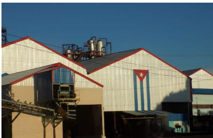
Empresa Agroindustrial Azucarera Manuel Fajardo (Mayabeque)