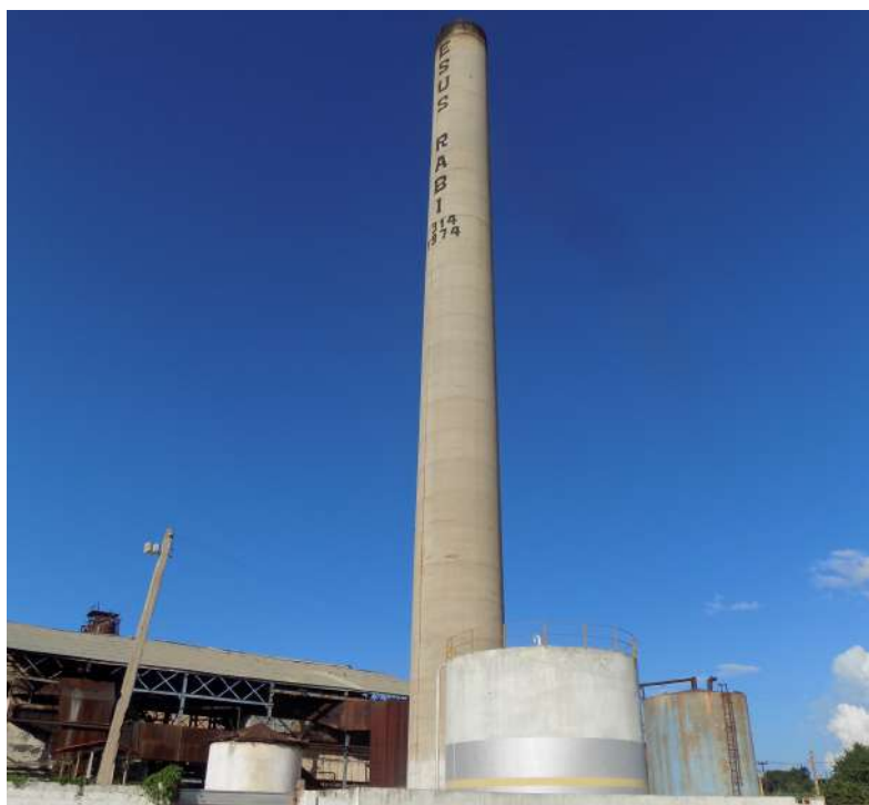
Empresa Agroindustrial Azucarera Jesús Sablón (Matanzas)