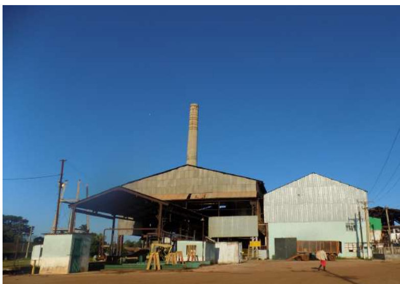
Empresa Agroindustrial Azucarera René Fraga (Matanzas)