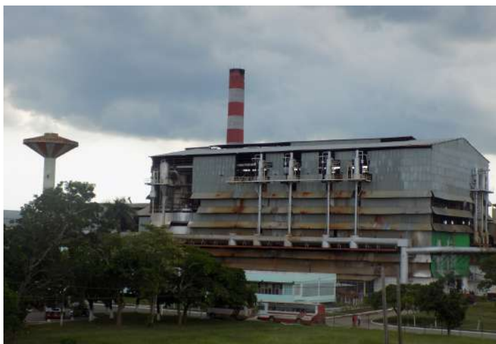
Empresa Agroindustrial Azucarera 30 de noviembre (Artemisa)