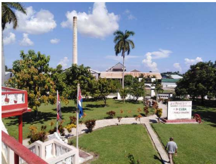
Empresa Agroindustrial Azucarera Harlem (Artemisa)

En el mes de septiembre se realizó visita de control a las Empresas Agroindustriales Azucareras de la región occidental relacionado con el Sistema de Comunicación Institucional, Patrimonio Histórico Azucarero y Gestión Documental.