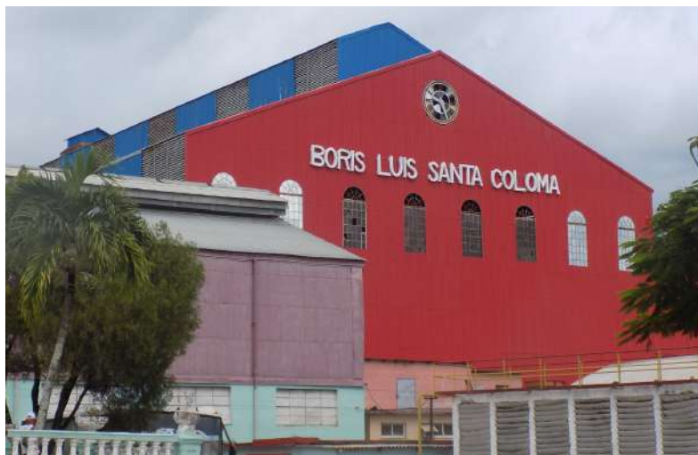
Empresa Agroindustrial Azucarera Boris Luis Santa Coloma (Mayabeque)