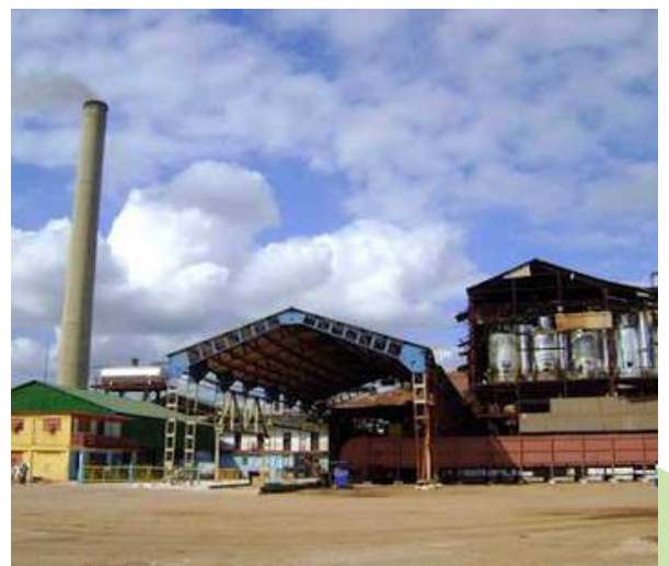
EAA JESÚS SABLÓN