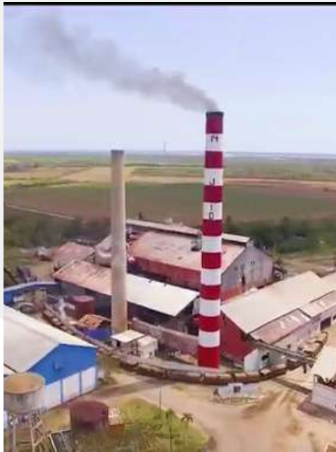
EAA 14 DE JULIO