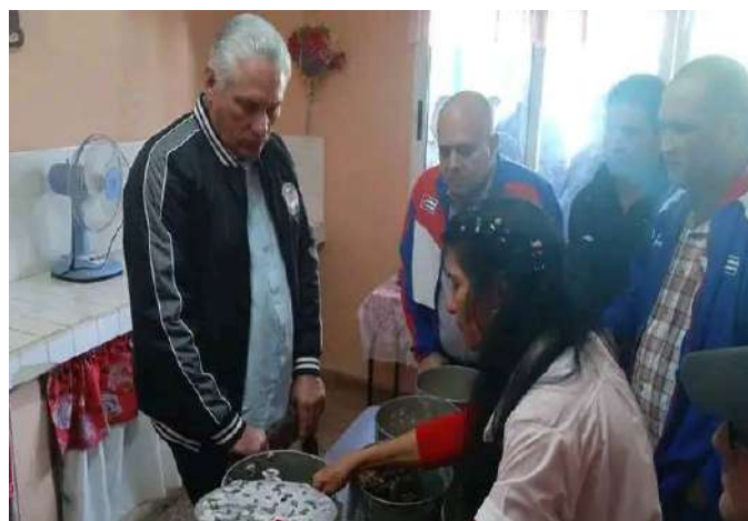
Empresa Agroindustrial Azucarera Ciro Redondo y CREE. Ciego de Avila.