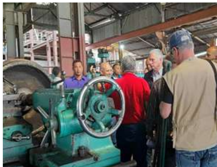
Empresa Agroindustrial Azucarera Uruguay