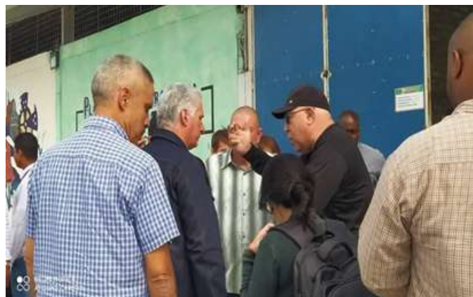
Empresa Tecnoazucar Las Tunas